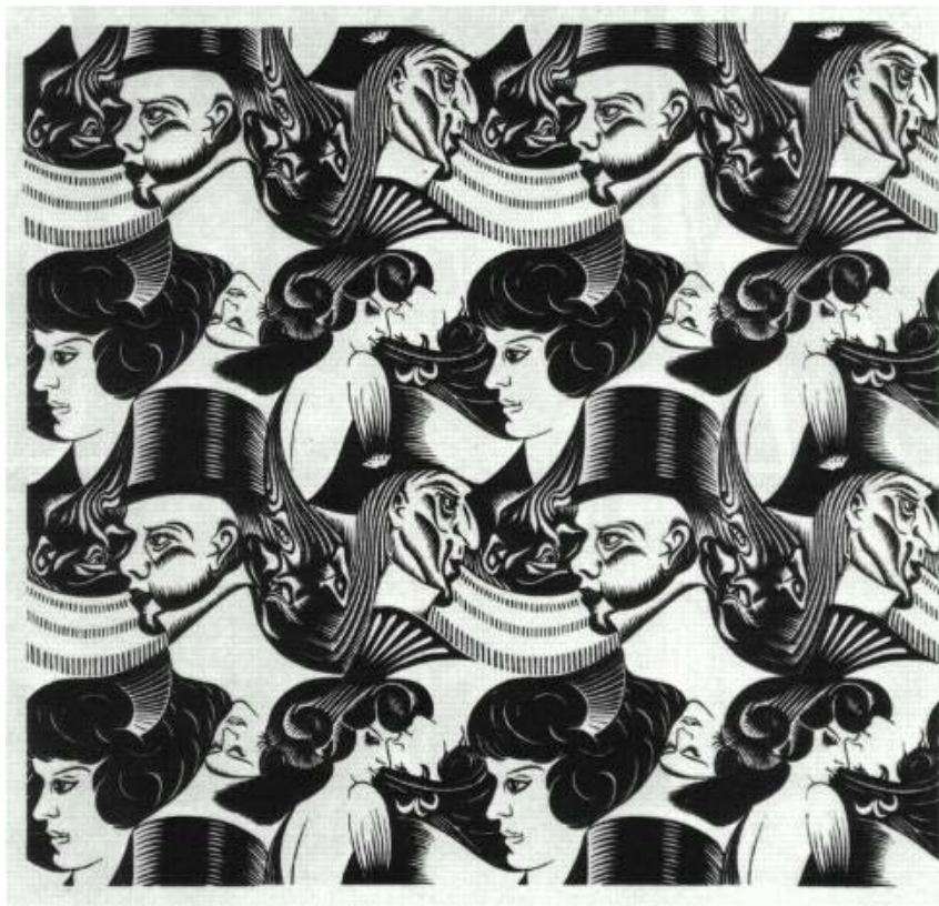
Гравюра М. Эшера «Восемь голов»

«В работах этого художника можно увидеть не только построения, отвечающие различным системам симметрии, «характеризующим, скажем, логарифмическую спираль Я. Бернулли или так называемую спираль Корню, играющую столь значительную роль в волновой оптике», – писал российский математик И. М. Яглом в отзыве на книгу Б. Эрнста «Волшебное зеркало М. К. Эшера», – но и реализацию в художественных образах таких глубоких математических идей, как учение об узлах и «бесконечно удаленных точках» плоскости 1 .